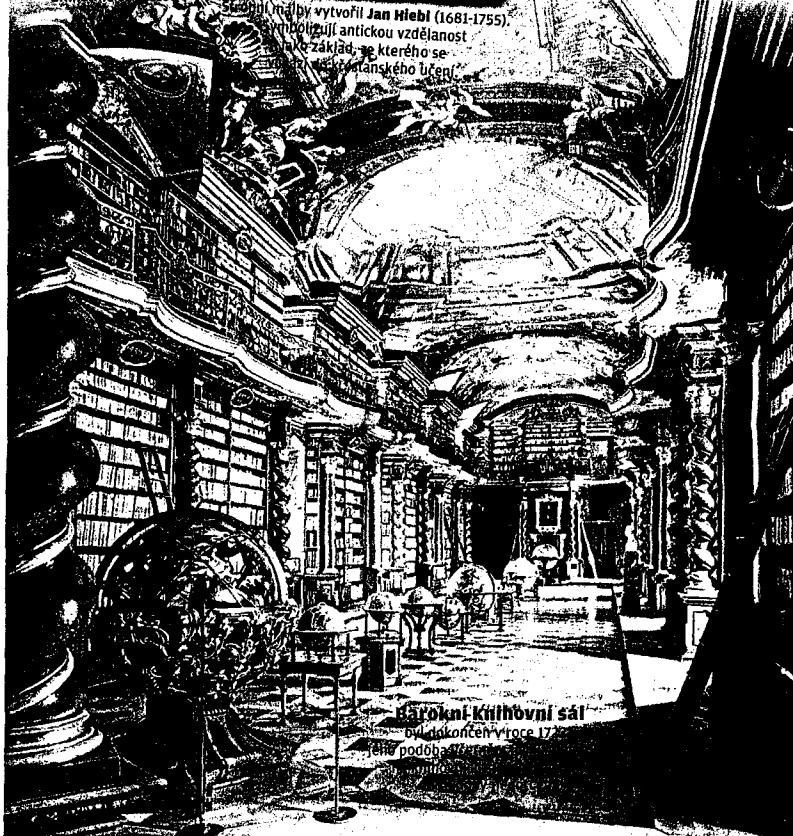
Barokní knihovní sál

Měření odhalila jistou periodicitu. Ke vzrůstu koncentrací docházelo vždy se začátkem návštěvních hodin, maxima bylo dosaženo zhruba na jejich konci. Dva výraznější výkyvy křivky může mít na svědomí větší počet návštěvníků.